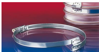
スパイラルホースクランプ: 212