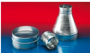
メタルコネクター: 270-271