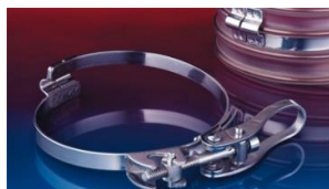
クイッククランプ: 213