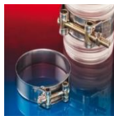
ビントルホースクランプ：211