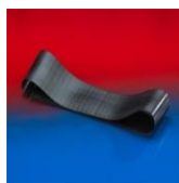
プロテクションテープ：228