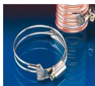
シーリングホースクランプ：216