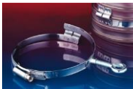
アイレット付クランプ: 217