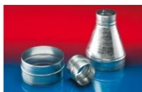
メタルコネクター: 270-271