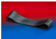
プロテクションテープ: 228