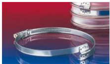
スパイラルホースクランプ: 212