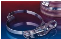
クイッククランプ: 213