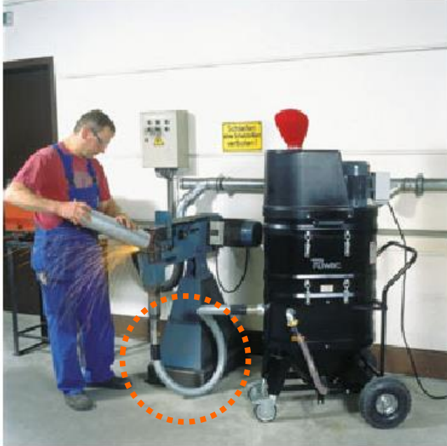
装置下部に排気吸引用で使用している例