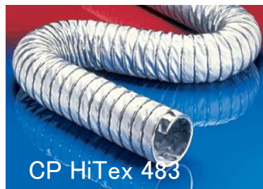
CP HiTex 483