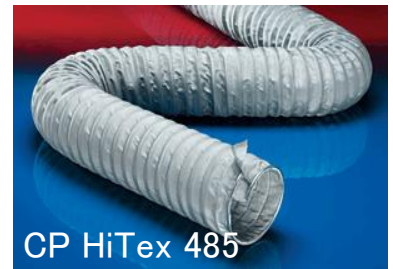
CP HiTex 485