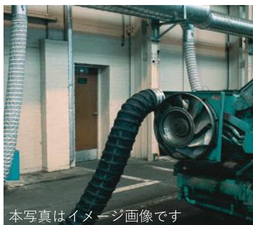
本写真はイメージ画像です

自動車メーカー各社 自動車部品メーカー各社 建機メーカー各社 分析器メーカー 造船会社、防衛省 製鉄会社、農機メーカー他