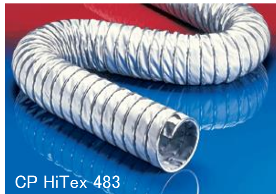
CP HiTex 483