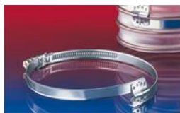
スパイラルホースクランプ:212