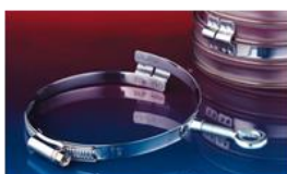
クイッククランプ:213