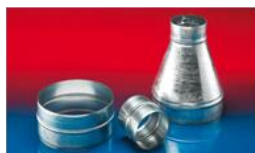
メタルコネクター:270-271