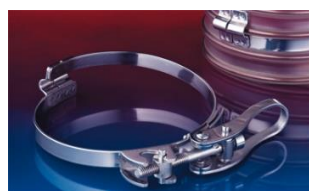
クイッククランプ: 213