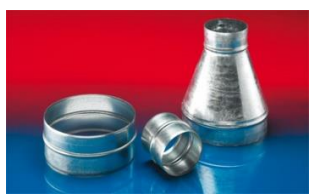
メタルコネクター: 270-271