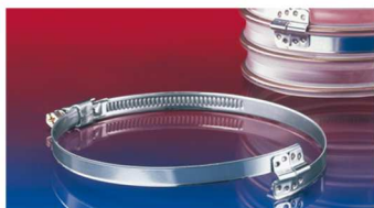
スパイラルホースクランプ：212