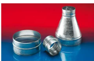
メタルコネクター：270-271