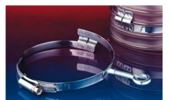
アイレット付クランプ：217