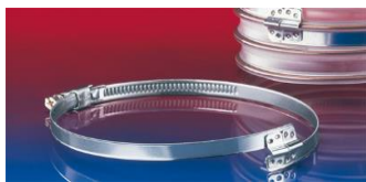
スパイラルホースクランプ: 212