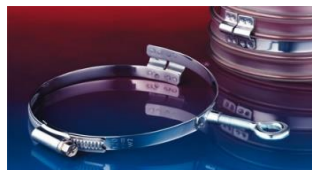
アイレット付クランプ: 217