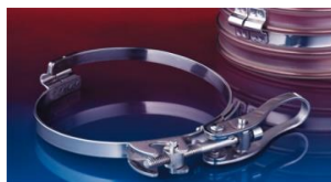
クイッククランプ: 213