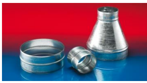
メタルコネクター:270-271