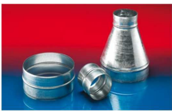
メタルコネクター:270-271