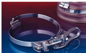
クイッククランプ : 213