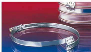
スパイラルホースクランプ : 212