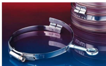
アイレット付クランプ : 217