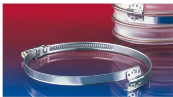
スパイラルホースクランプ: 212