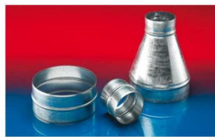
メタルコネクター: 270-271