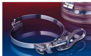
クイッククランプ: 213