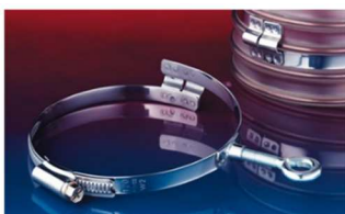
アイルレット付クランプ: 217